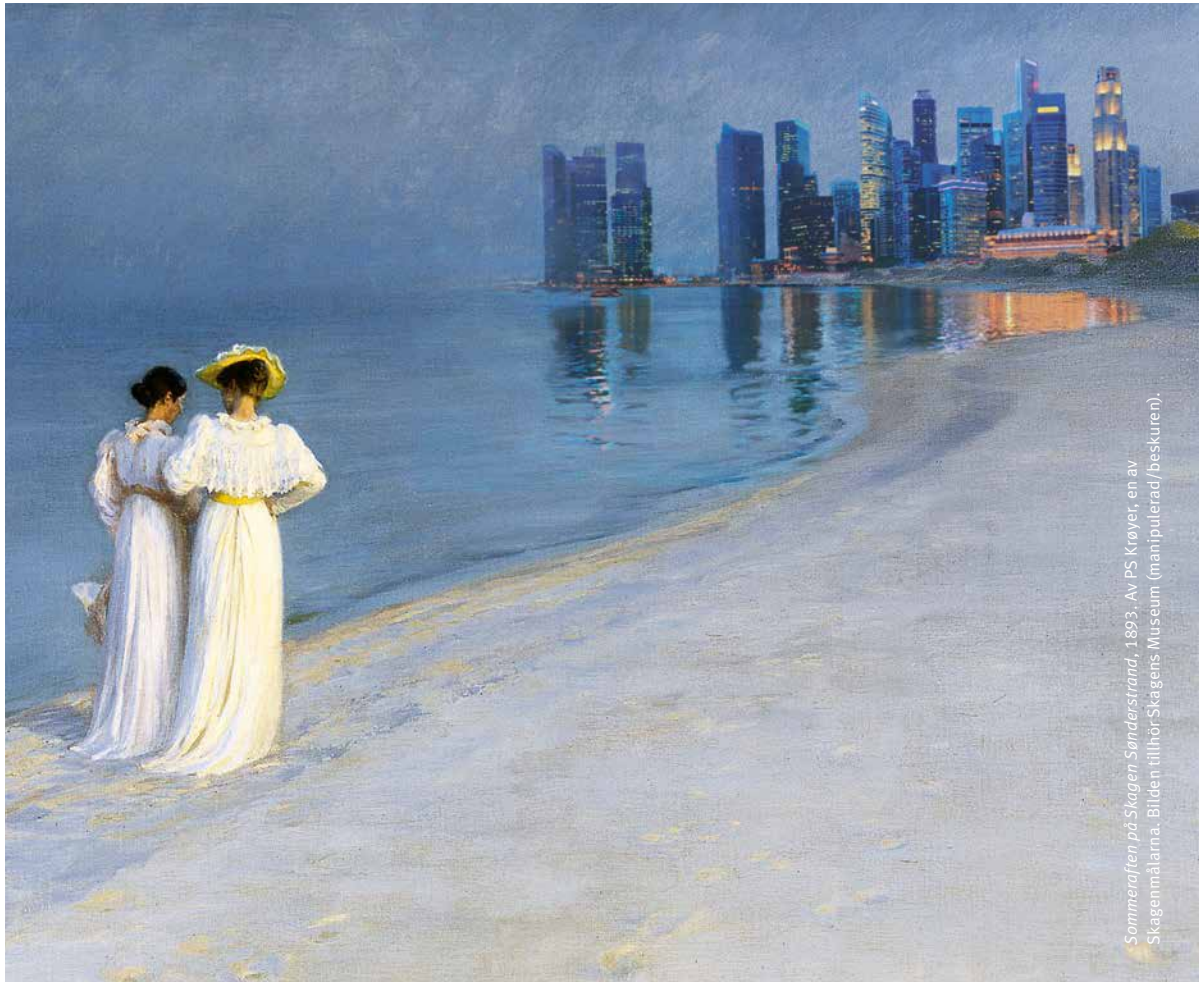
Sommeraften på Skagen-Sunderstrand, 1893. Av PS Krøyer, en av Skagenmålarna. Bilden tillhör Skagens Museum (manipulerad/beskuren).