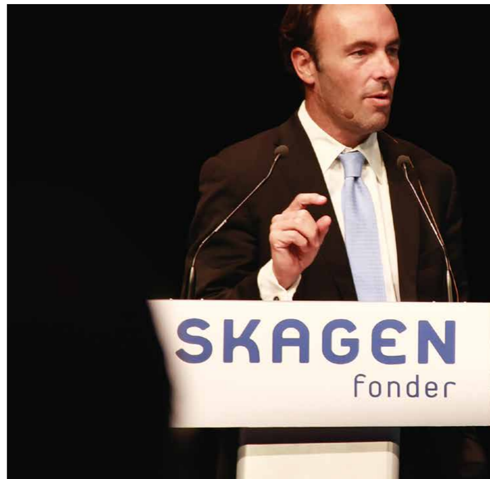
Nedan den amerikanske hedgefondförvaltaren Kyle Bass, som vid 2015 års konferens varnade för investeringar i läkemedelsbolag som i första hand tjänar pengar på gamla patent snarare än genom innovation. Bass är annars känd för att ha fått dramatiskt rätt både när han förutspådde subprime-lånebubblan och den europeiska statskuldskrisen.